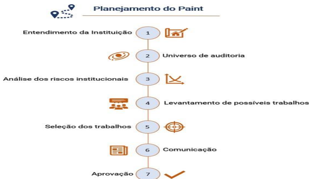
Figura 3 – Processo de planejamento do Paint

Caso haja necessidade de alterar o PAINT, seja para incluir ou excluir atividades, em razão de fatores supervenientes internos ou externos, a UCCI deverá submeter proposta devidamente justificada ao Prefeito Municipal, com prévia comunicação à Coordenação da UCCI.